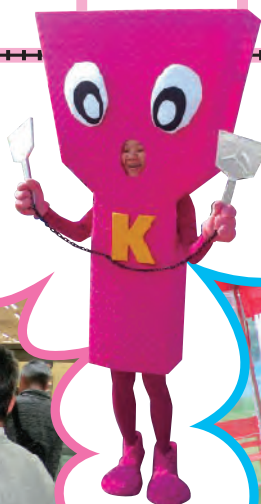
コテリン 公式キャラクター コテリンピック